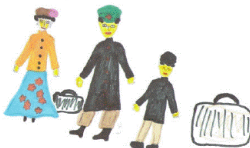
Тонкий с семьёй выходит из поезда.