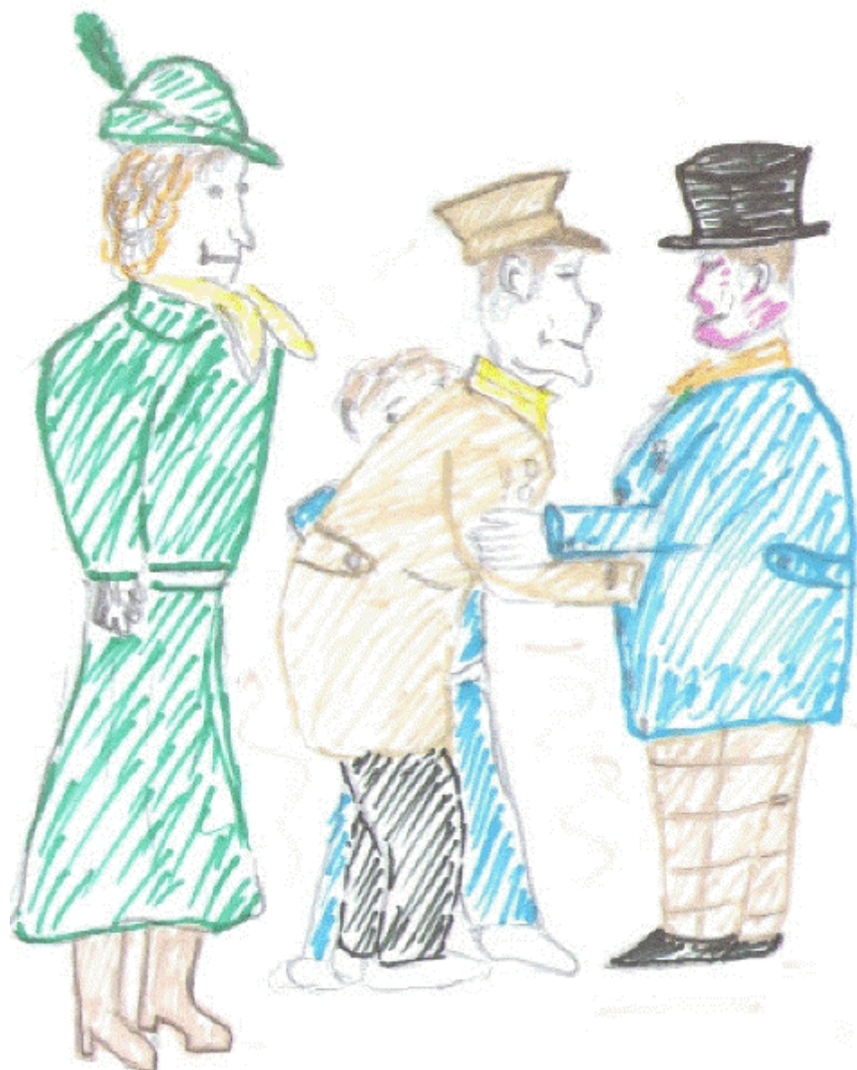
Неожиданная встреча Толстого и Тонкого.