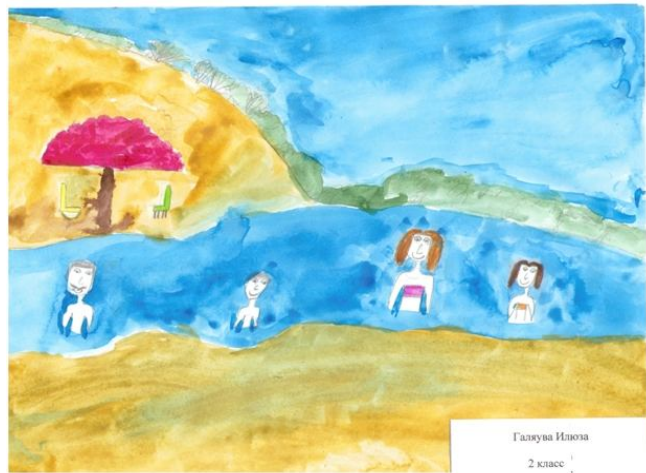
Галуева Илюза 2 класс