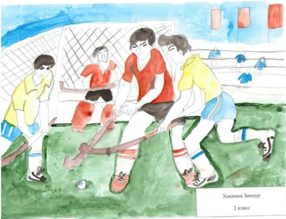
Хакимов Зиннур 2 класс